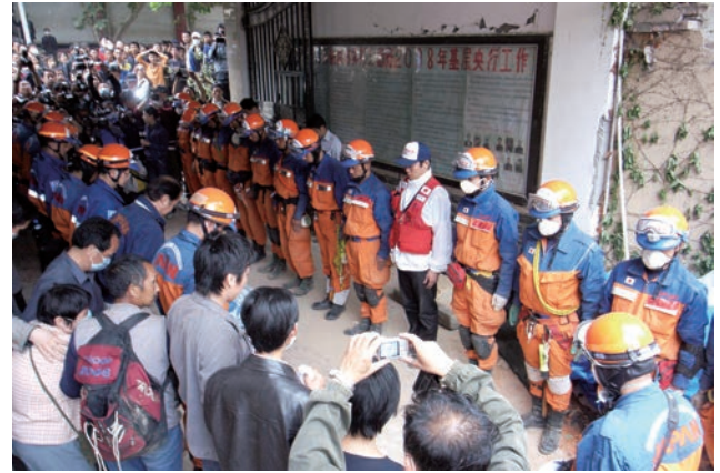
救出した母子に対して黙祷を捧げる救助隊員 （平成20年5月中国四川省における大地震災害）