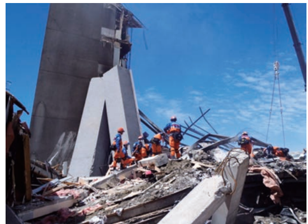
CTVビルにおける懸命の搜索活動 （平成23年2月ニュージーランド南島における大地震災害）