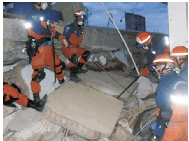
パダン市街地における懸命の搜索活動 （平成21年10月インドネシア西スマトラ州における大地震災害）